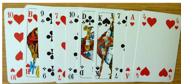
Das sieht man nach den Mischaktionen

Nun das Übliche: mehrfach abheben, R_a - und L_a -Aktionen. Letztere sind natürlich so gewählt, dass die zyklische Reihenfolge die gleiche oder die gespiegelte ist wie am Anfang. Mal angenommen, der Zauberer hat als unterste Karte den ♥B gesehen und es ist – nachdem der Stapel umgedreht und aufgefächert wurde – das folgende Blatt entstanden: