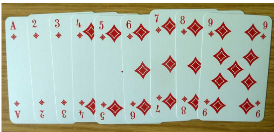
Neun Karten, der Größe nach geordnet

Die Karten werden zu einem Stapel zusammengeschooben und umgedreht.